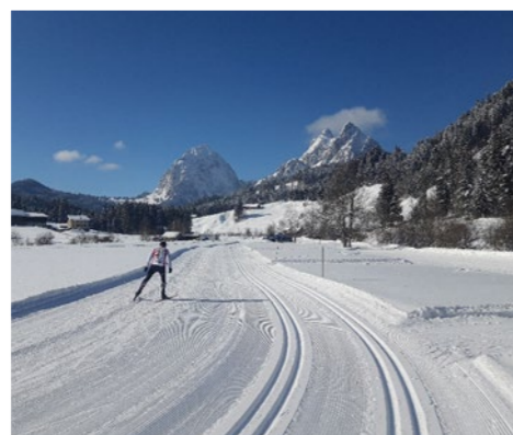
Langlaufparadies Cross-country paradise