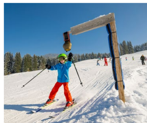
Traumhafte Skipisten Fantastic ski slopes