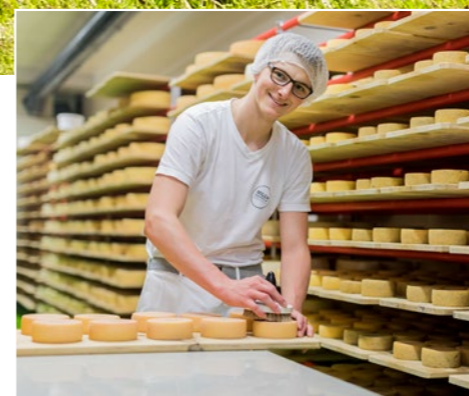
Milchmanufaktur – innovative Schaukäserei Milchmanufaktur – innovative show dairy