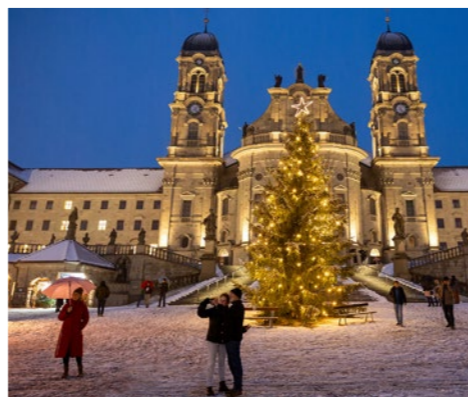
Stimmungsvoller Weihnachtsmarkt Atmospheric Christmas market