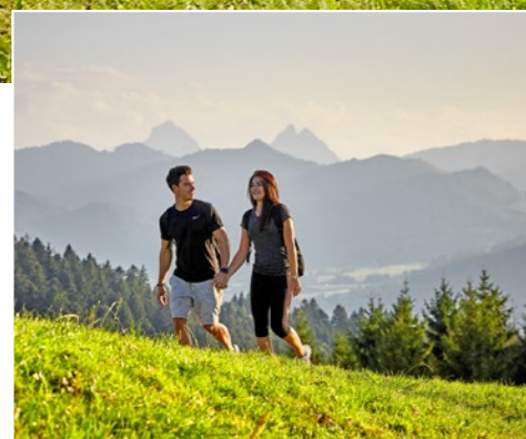
Wanderparadies – eintauchen in die Natur Hiker's paradise – immerse yourself in nature

In addition to beautiful natural surroundings, Einsiedeln can offer cultural highlights. The impressive baroque monastery is the heart of the town. Fascinating guided tours tell the stories hidden behind the monastery walls. Traditional markets, carnival events and captivating concerts are further attractions of this lively town.