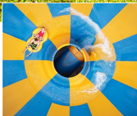
Alpamare – grösster Wasserpark der Schweiz Alpamare – largest water park in Switzerland