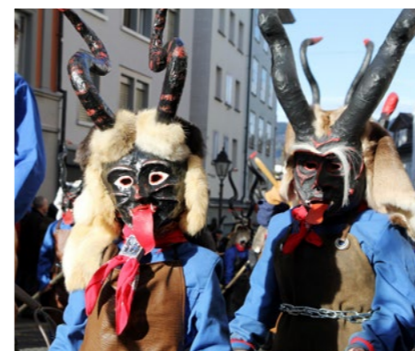
Kultur in einzigartiger Vielfalt Culture in a unique variety